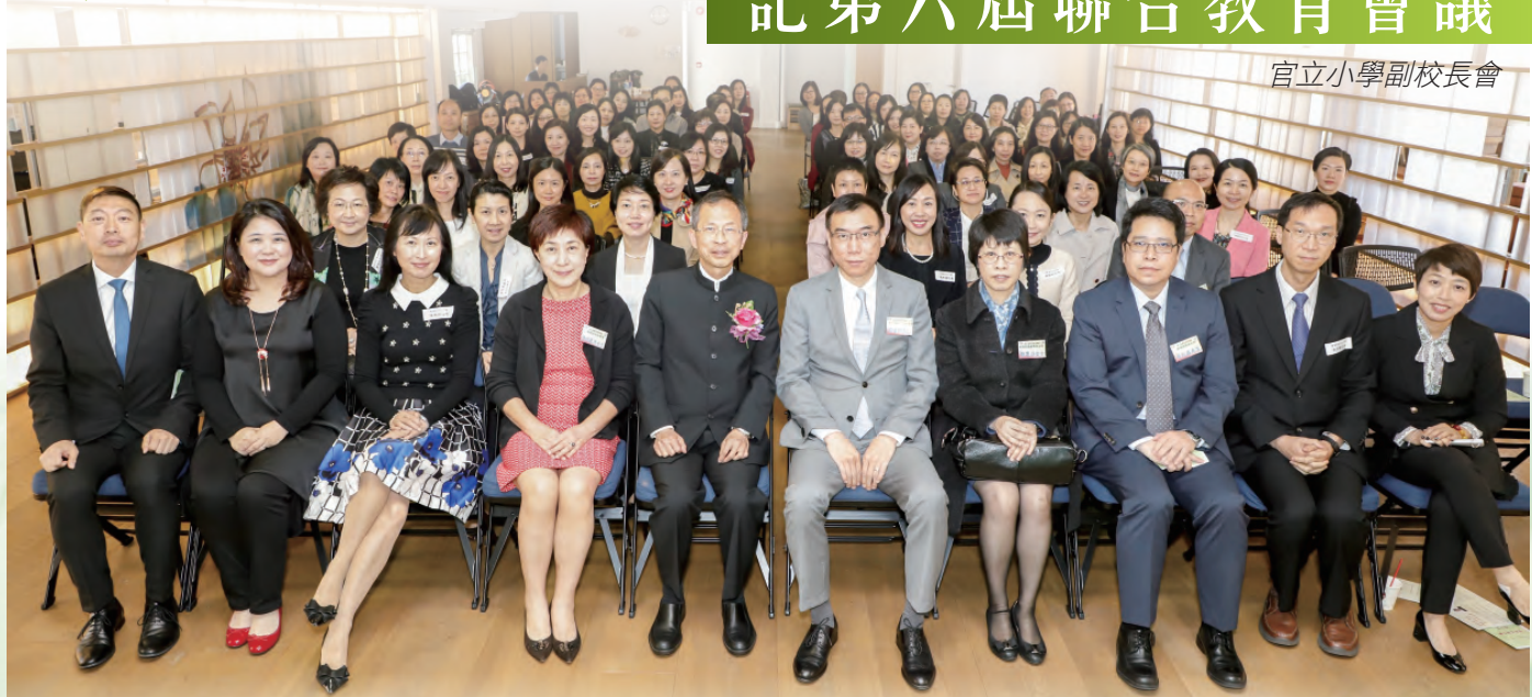
官立小學副校長會