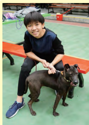
同學笑言牽引狗隻原來也是一門學問。

本校重視學生的生命教育，旨在讓學生「理解生命的意義，確立生命尊嚴的意識，高揚生命的價值」。(肖川、陳黎明，2013)廣義的生命教育，不應只囿於人的生命，而應該擴及萬物的生命。這也是「民胞物與」精神的體現。