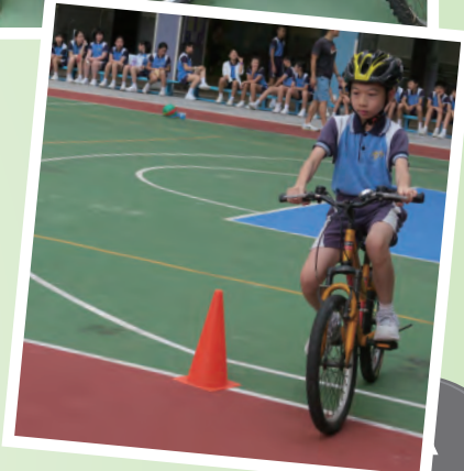
參加「單車安全訓練計劃」，讓大家可以夠在廣闊的校園騎單車，這體驗令人難忘。