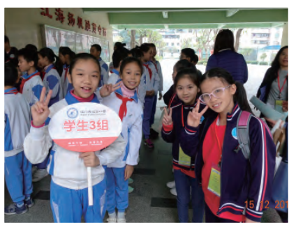
兩校學生作「一對一」配對參與學習交流

江華小學位於廣東省江門市，以「融貫中西，和諧發展」為教育理念，以「創立鮮明雙語特色，鑄就優質教育品牌」為辦學目標。近年，江華小學不斷加強雙語教學、動漫創客、和諧德育、網球文化等多元特色，推進學校教育的優質化。造訪江華小學當天，我們大清早已整裝待發。吃過早點後，我們一行四十一人便浩浩蕩蕩地出發了。抵達江華小學的大門，我們受到江華小學師生的熱烈歡迎。本校學生隨即獲邀請與江華小學的學生作「一對一」的配對，前往課室參與課堂學習及交流；而老師們則與江華小學的老師作學術研討及交流，並參與課堂觀課。隨後，本校學生透過兩文三語、輕鬆活潑的饒舌歌唱形式向江華小學師生們介紹本校的教學特色及理念。