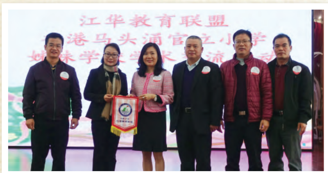
江華教育聯盟一眾校長致送紀念旗予本校。

透過兩校校長交流學校管理的經驗，大家分享了發展優質教育的理念；透過課堂參與，學生能認識及體驗內地同學的學習模式，分享學習心得；透過觀課及學術研討會，我們與內地老師能互相觀摩及交流教學心得，提升教學素質。透過兩校學生的表演，我們發揮創意，盡展潛能，增強學生的自信心。