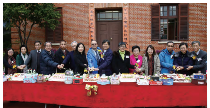
13位現任、前任長洲官中校長一起為110周年校慶舉行切餅儀式。

長洲官立中學110周年校慶壓軸活動為分別於本年三至六月舉辦的開放日暨校友日、晚宴、視覺藝術展及綜藝表演。十年樹木，百年樹人，長洲官立中學110周年校慶，蘊含歷屆師生的深厚情誼。屆時校友及各界好友將親臨指導，緬懷「長官」昔日的足跡，見證學生今日的成果，為長洲官立中學110周年校慶畫上完美的句號。