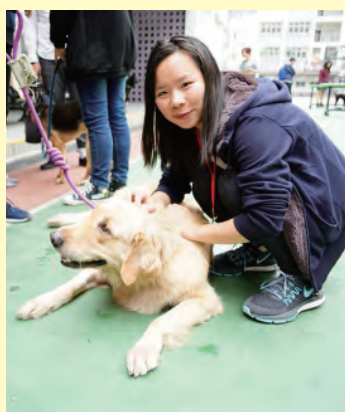
同學與動物打成一片。

為此，本校的義工團隊在籌辦過不同形式、以人為本的社會服務後，決定再踏前一步，與非牟利動物保護團體「阿棍屋」在2017年12月23日合辦動物領養日：開放學校作場地，讓公眾人士到場與待領養的貓、狗互動，甚至即場辦理領養手續，讓動物有機會覓得新家。同學則擔任義工，不但負責活動前的宣傳工作，在領養日當天更要負責照顧狗隻、清理場地、接待到場參觀者、協助辦理領養手續及為「阿棍屋」進行義賣籌款等。