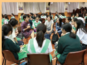
Mentoring in the field of science and research