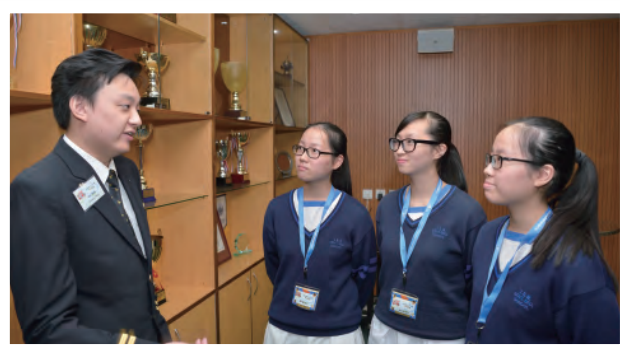
飛機師與同學分享工作心得

講者除詳細為同學介紹所屬行業的入職條件、工作範圍、工作時應具備的能力和素質、行業的晉升階梯及發展前景外，還會與同學分享他們在職場上最深刻的個人體驗，分享如何衝破種種困難、挑戰、有趣或難忘的工作經歷，讓同學明白正確的工作態度與工作得著。對於從未踏入職場的同學來說，這些寶貴的分享都給予他們重要的學習與成長啟示，獲益良多。