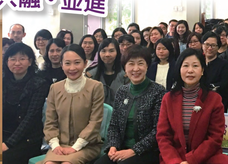
教育局副秘書長黃邱慧清女士(右二)到學校為同工打氣。

為了促進官立小學教師之間的學術交流，提升整體官立學校的專業水平，由教育局副秘書長黃邱慧清、首席助理秘書長容寶樹及首席教育主任黃廖笑容全力推動，官立學校組與官小聯校教師發展日籌委會(包括北角官立小學、海壩街官立小學、香港南區官立小學、九龍塘官立小學、愛秩序灣官立小學及荃灣官立小學)於二零一八年一月二十三日舉辦第二屆官立小學聯校教師發展日，當天有全港三十四所官立小學共一千六百多位教師同工一同參與。