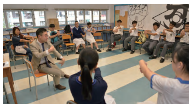
家長同學齊做物理治療

天官職業博覽另一個獨特之處，就是博覽會後的延伸學習活動。部分講者會邀請曾出席他們主講活動的同學到其企業或工作間參觀，讓同學進一步觀察真正的職場實況。例如在2017年12月9日，曾於職業博覽出席過酒店及旅遊及中、西餐飲職業分享的同學，有機會到「香港酒店及旅遊學院」、「中華廚藝學院」及「國際廚藝學院」參觀及進行實地考察。聽過飛機維修分享的同學亦於2017年12月16日參觀與飛機工程相關的公司，了解行業情況、認識招聘的要求及員工培訓計劃。出席過空中服務員及飛機師職業分享的同學亦將享有機會到一所航空公司的總部進行實地參觀。