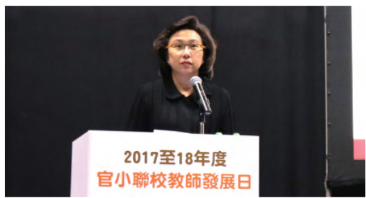
教育局常任秘書長楊何蓓茵女士在大會上致辭勉勵官校同工。

這次活動主題是「同行·共融·並進」，就如大會主禮嘉賓教育局常任秘書長楊何蓓茵在致勉辭時所言，官立學校是一個大家庭，各位教師在教學的路途上是「同行」的夥伴，官校之間亦應該「共融」，互相交流學習以提升學與教的質素，讓官校同工能「並進」前行，迎接未來的挑戰。