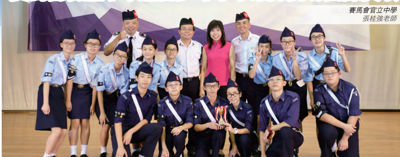
獲得隊制公開組季軍，喜出望外！

為擴闊學生視野，鼓勵學習及促進文化交流，賽馬會官立中學基督少年軍軍樂隊組織了「新加坡軍樂文化交流之旅」，參加當地基督少年軍第十四屆軍樂節比賽，並在多個項目中獲得獎項，成績令人振奮。