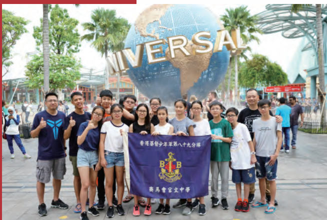
參觀新加坡環球影城是全程最輕鬆的一天。