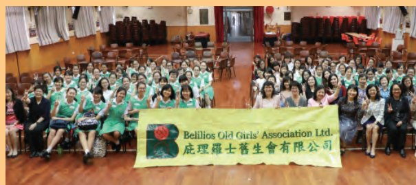
Opening ceremony of BOGA Mentorship Programme