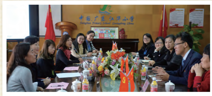
兩地老師進行教學交流活動

在這次的行程中，我們分別參觀了五邑華僑華人博物館和圭峰山國家森林公園，讓我們認識及了解五邑華僑鄉的歷史文化、風土人情、經濟發展及民間藝術，使是次學習經歷更為豐盛。