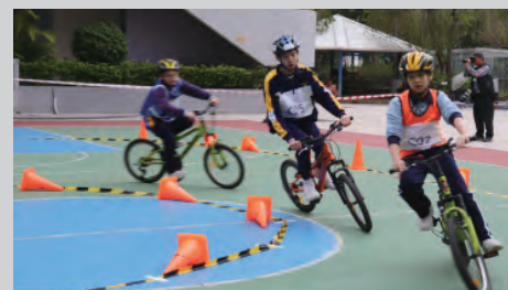
參賽的健兒們積極投入，一起享受單車的樂趣。