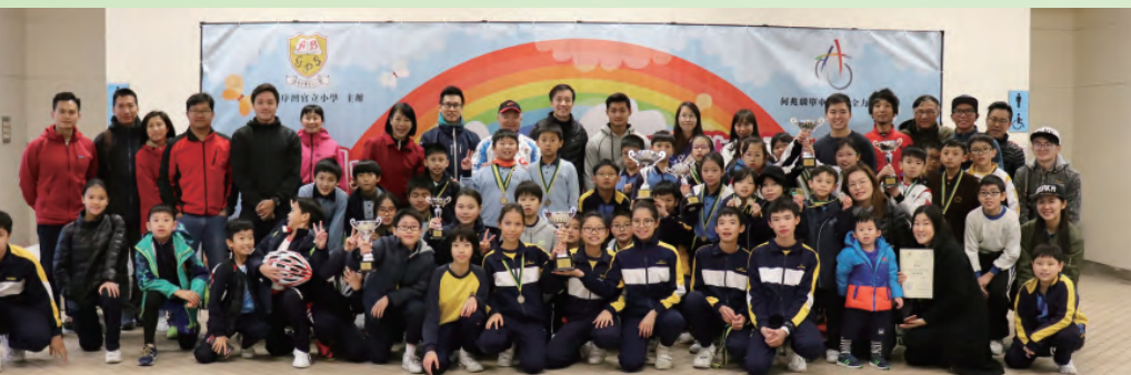
恭喜各位健兒們，大家都滿載而歸，大家拍照留念。