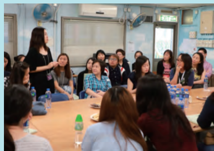
Debriefing with alumni for the next Career Expo