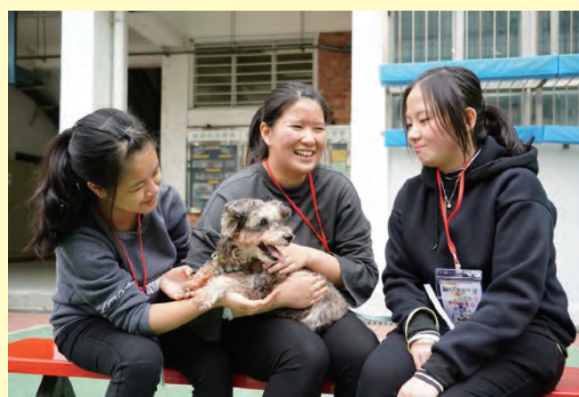
同學真摯的笑容盛載着人與狗的情誼。

到了領養日當天，公眾人士的反應十分踴躍，不少人進場參觀、捐款及辦理領養動物的手續，有外籍人士在開放時間前已在校門外等候，希望能與待領養的狗隻多接觸，更有人和家庭成員一起遠道由屯門區而來。另外，電視台也專程到場拍攝和報道實況。待領養的狗隻平日少有機會在「阿棍屋」以外的地方活動，也較少與人接觸，當天牠們在義工牽引下，在學校操場漫步遊玩。人狗互動，不亦樂乎。