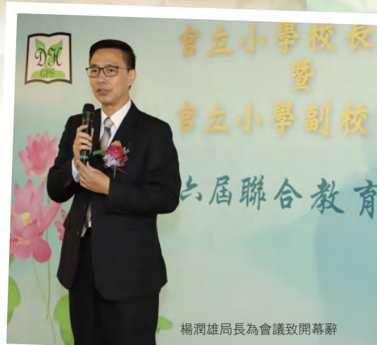
楊潤雄局長為會議致開幕辭

曾先生的真知灼見令與會者獲益良多，其幽默妙語亦令人見識領袖一語解難的風範，相信與會者日後必有機會運用講者所闡釋的道理，協助大家在工作中掌握輕重，進退有度。